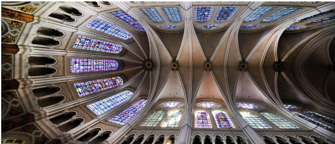
Catedral de Chartres

3.- Tracta d'imaginar l'impacte emocional que els edificis d'aquesta mida pogueren provocar en un personatge del segle XIII que acaba d'arribar a Chartres acostumat al camp i a poblacions petites.