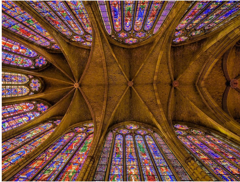
Catedral de León